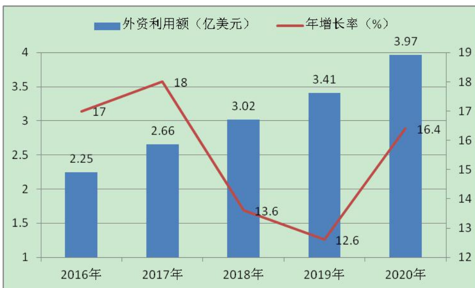
图 1-1 “十三五” 期间外资利用情况

进了中电彩虹、九兴控股、慕容集团、拓浦精工、亚洲富士电梯、桑德集团、帝立德等一批行业龙头企业，其中“三类500强”企业26家，为我市产业发展注入了强劲动力。