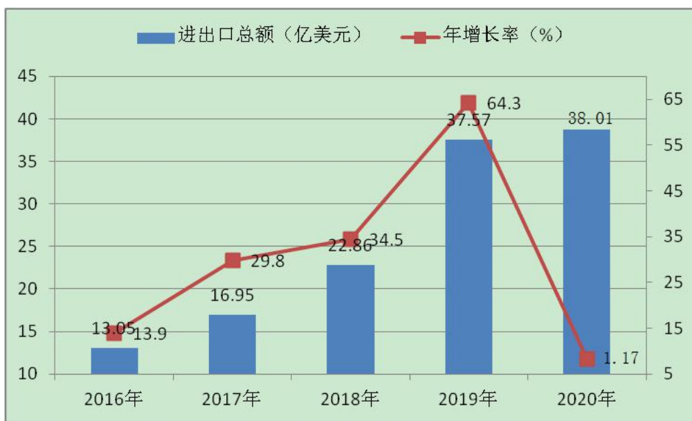
图 1-3 “十三五”期间进出口总额情况

二、对外贸易实现快速增长。全市有进出口实绩的企业达 903 家，比 2015 年底新增 728 家，其中年进出口额超 1 亿美元企业 2 家，培育了工程机械、电子信息、生物中医药、小五金、发制品、打火机、服饰箱包鞋帽、体育用品、竹木、果蔬等新十大出口基地；2020 年货物贸易进出口总额、出口额分别达 38.01 亿美元、37.27 亿美元，比 2015 年分别增长 232%、258.4%，外贸依存度从 2015 年的 5.12% 上升到 11.65%。出口总量、有进出口实绩的企业数量和出口退税额居全省第 2 位，2018 年发制品、打火机、箱包三个基地获批国家外贸转型升级基地，连续四年获评全省外贸先进市州。