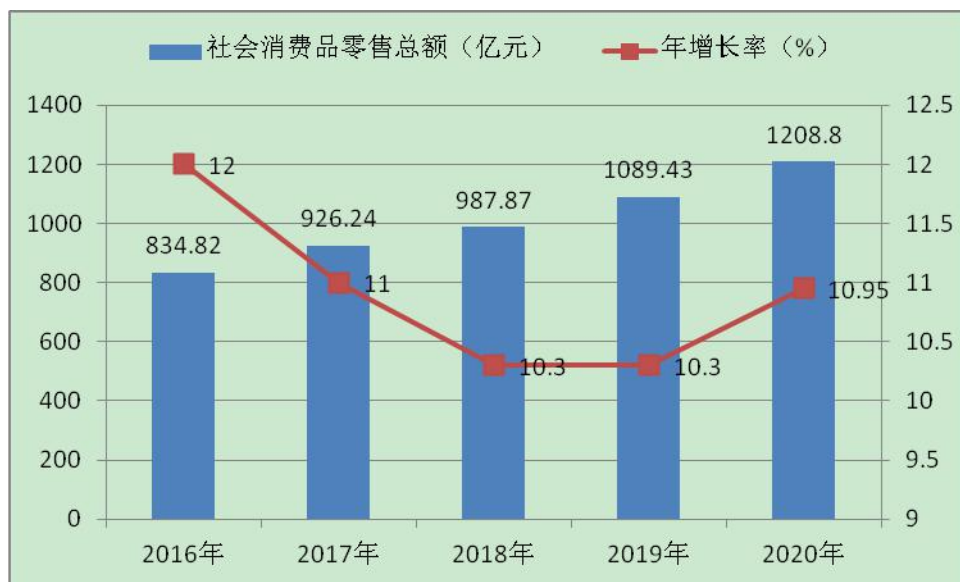
图 1-4 “十三五”期间社会消费品零售总额情况

“住”“购”等商贸供给不断丰富优化。商贸服务业发展迅速，编制完成《邵阳市城区商业网点规划》，餐饮、家政、特许经营等行业新型业态不断出现。全市现有成品油加油站点 483 个、拍卖企业 16 家、特许经营备案企业 4 家、报废机动车回收拆解企业 5 家、二手车交易市场 14 家、再生资源回收企业 800 余家、全国绿色示范商场 1 个、“湖南老字号”品牌 8 个。“十三五”期末限额以上贸易企业达到 1953 家，比“十二五”末新增 947 家。电子商务发展迅速，电子商务交易额从 2015 年的 80 亿元增长到 400 亿元，年均增长 50%。全市 9 个县市全部列入全国电子商务进农村综合示范县，2019 年、2020 年连续两年获评全省电商扶贫工作优秀市州。全市通过邮政、供销、农村淘宝等电商平台建成县级电商公共服务中心 9 个、发展村级电子商务网点 1831 个，其中贫困村电商服务站 970 个，覆盖率达 90%。