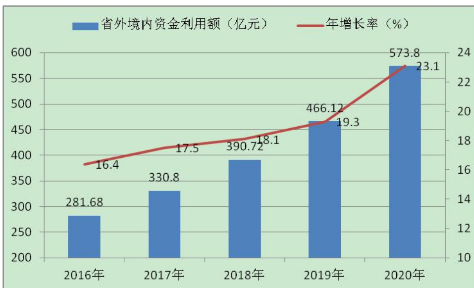
图 1-2 “十三五” 期间省外境内资金利用情况